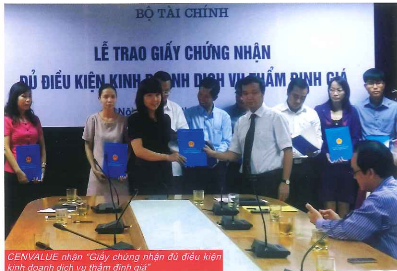
CENVALUE nhận "Giấy chứng nhận đủ điều kiện kinh doanh dịch vụ thẩm định giá"