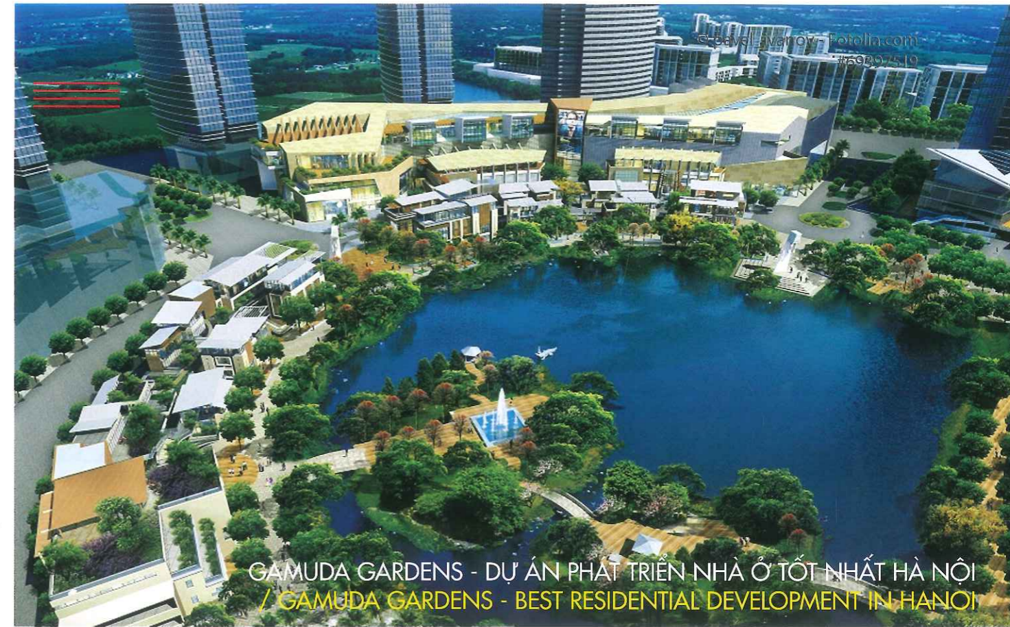
GAMUDA GARDENS - DỰ ÁN PHÁT TRIỂN NHÀ Ở TỐT NHẤT HÀ NỘI / GAMUDA GARDENS - BEST RESIDENTIAL DEVELOPMENT IN HANOI