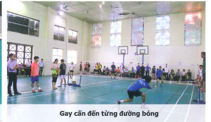
Gay cấn đến từng đường bóng