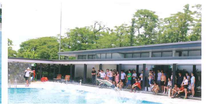
Xuất phát chậm mất rồi