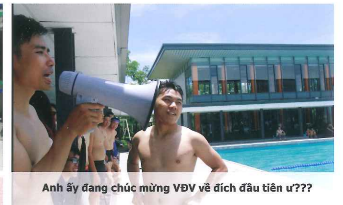
Anh ấy đang chúc mừng VĐV về đích đầu tiên ư???