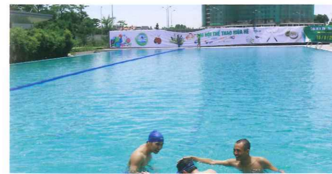
Không sao. Đừng buồn. Còn mùa sau mà...