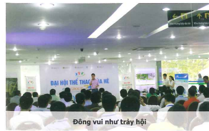
Đông vui như trảy hội