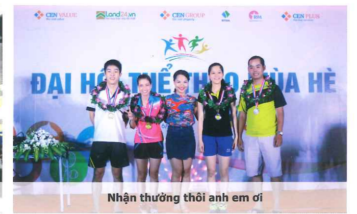
Nhận thưởng thôi anh em ơi