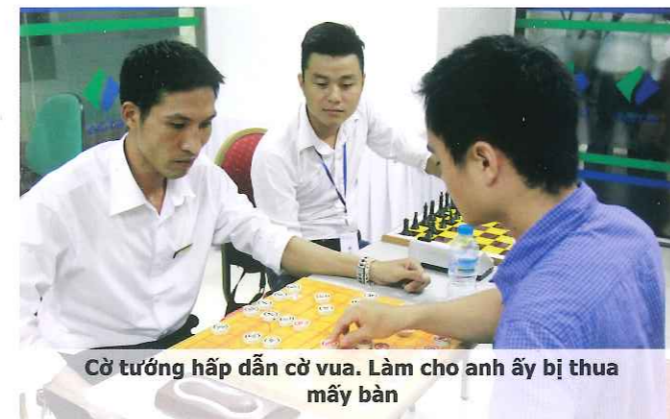
Cờ tướng hấp dẫn cờ vua. Làm cho anh ấy bị thua mấy bàn