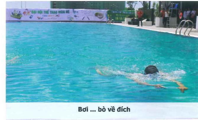
Bơi ... bỏ về đích