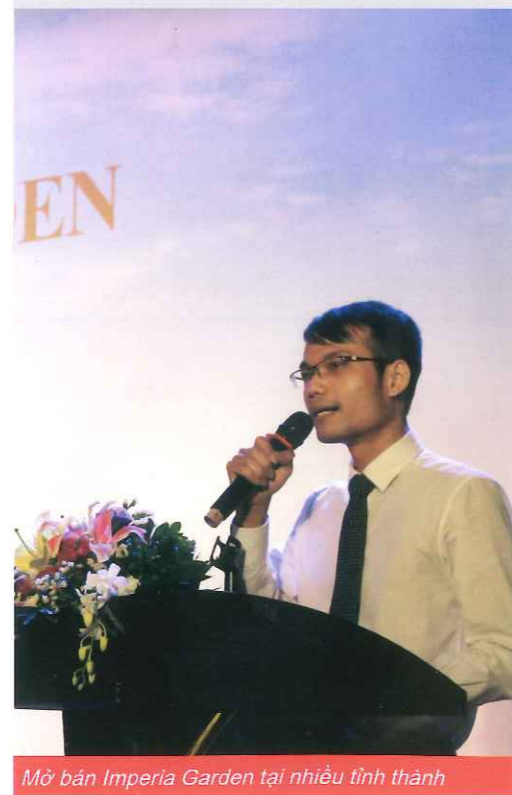
Mở bán Imperia Garden tại nhiều tỉnh thành

According to representatives of supermarkets, most of the opens for sale in the provinces are welcomed by many customers and create a good effect.